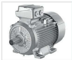
INOMATICS Marka Motor