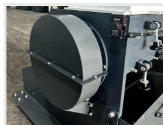
2. Volan Sistemi