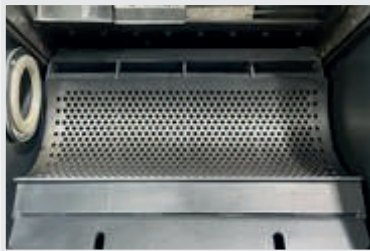
Aşınmaya Dayanıklı Elek