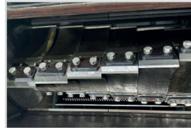
Kademeli Bıçak Sistemi