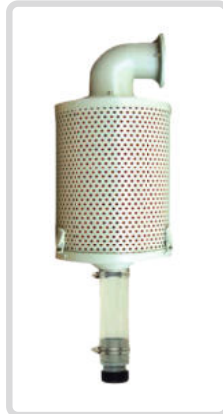
Hava Çıkış Filtresi