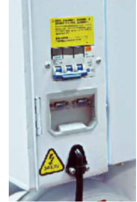
RS485 İletişim Arayüzü