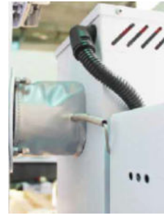
Çift Katmanlı İzolasyonlu Tasarım