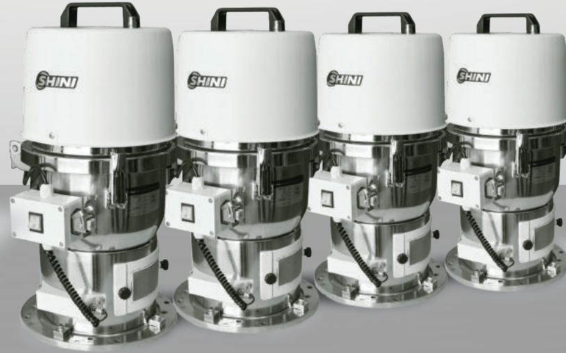
SAL-5HP-UG & 4xSHR-12U-S