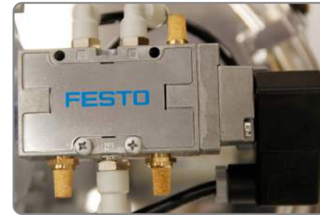
Vakum Kesme Valfi